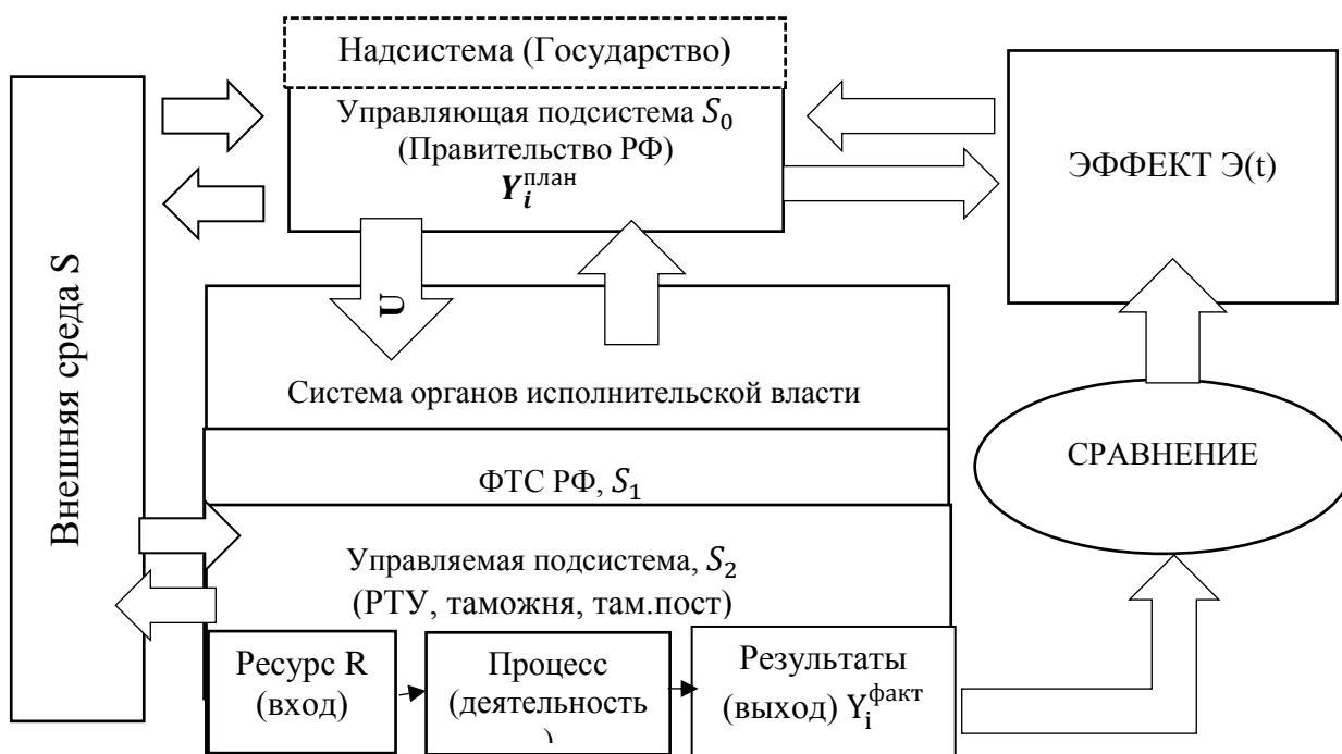
Рис.2. Модель эффективности функционирования таможенных органов

обеспечивать соблюдение таможенного законодательства и реализацию государственного регулирования в сфере ВЭД [10]. Чаще всего в качестве показателя в данном случае рассматривается уровень собираемости таможенных платежей. При этом важную роль в реализации данного показателя играет таможенный контроль.